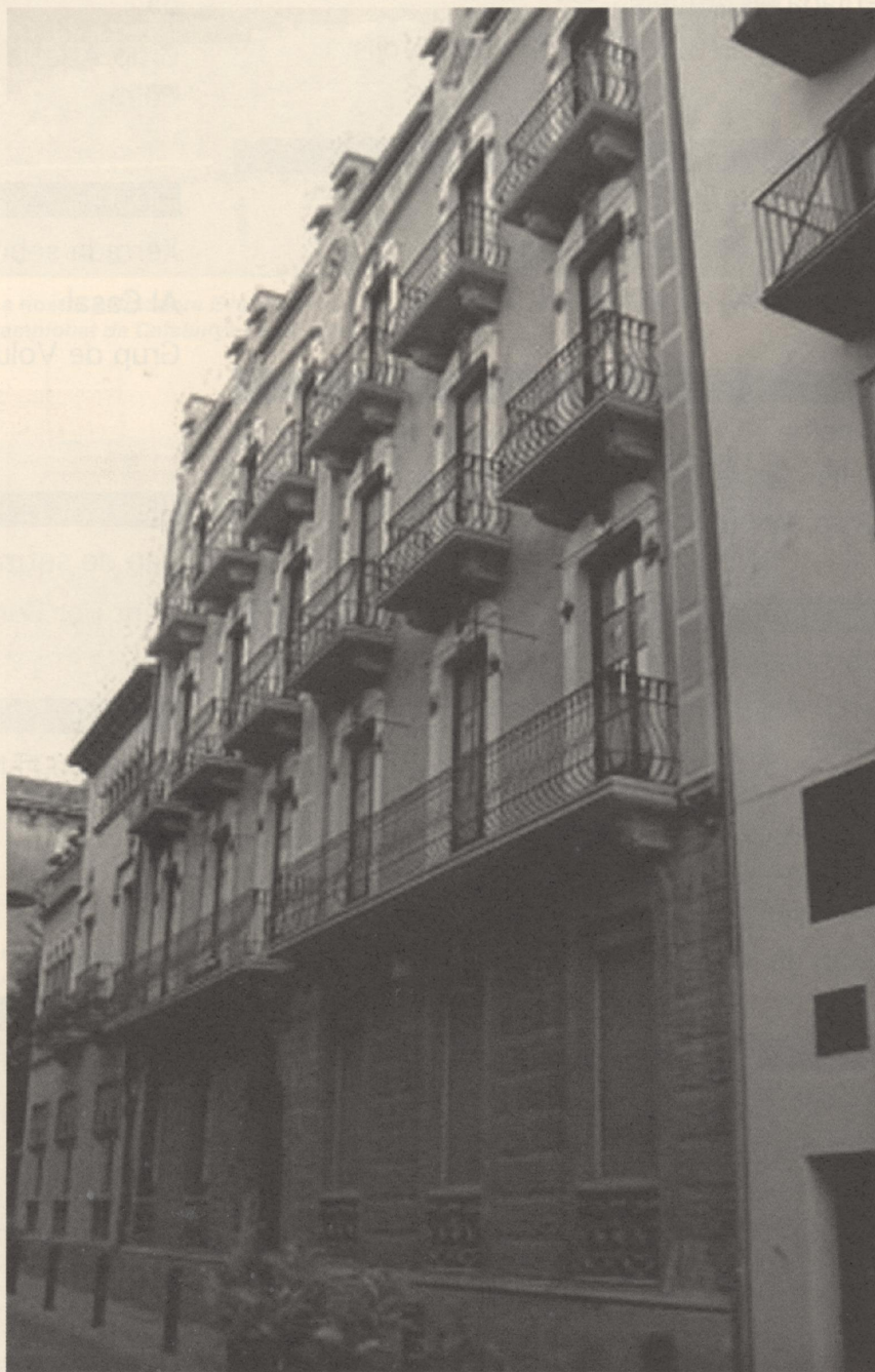
SEU D'ÒMNIUM CULTURAL A GIRONA ON ES FAN ELS CURSOS DE CATALÀ PER A ADULTS.

malitzar de dilluns a divendres de 6 a 9 del vespre a la seu de la delegació gironina d'Òmnium Cultural: